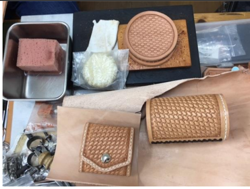
財布やコースター等を制作しています