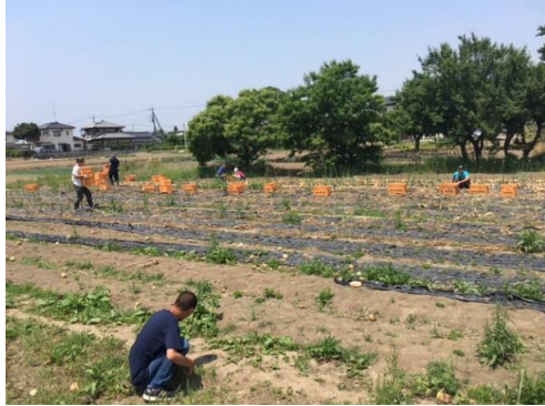
農作業班では玉ねぎを栽培しています