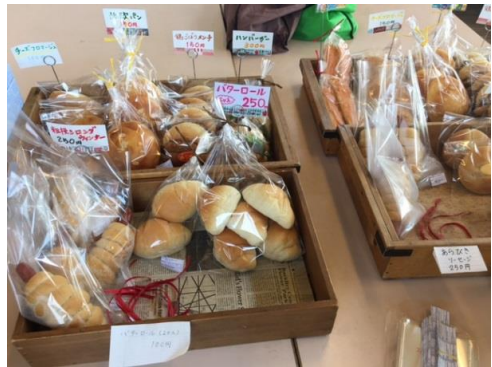
パンも作っています