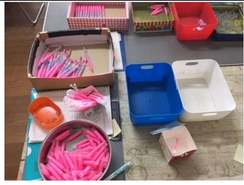
ボールペンの組立て作業です