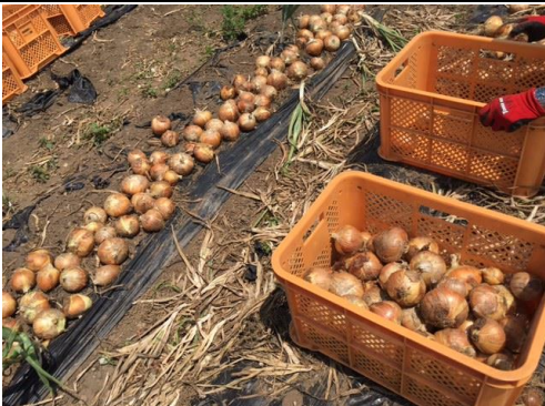
収穫した玉ねぎです