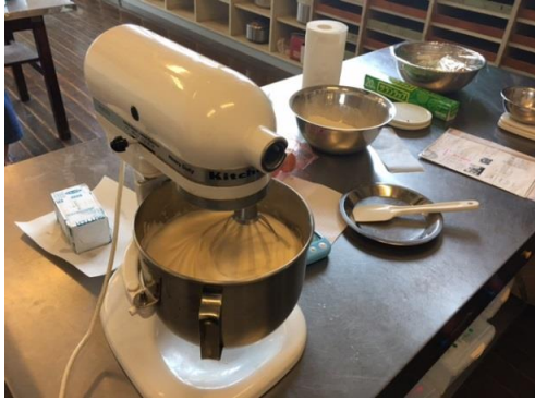
食品班にてシフォンケーキを作っています