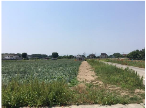
8万本の苗を植えているとても広い玉ねぎ畑です